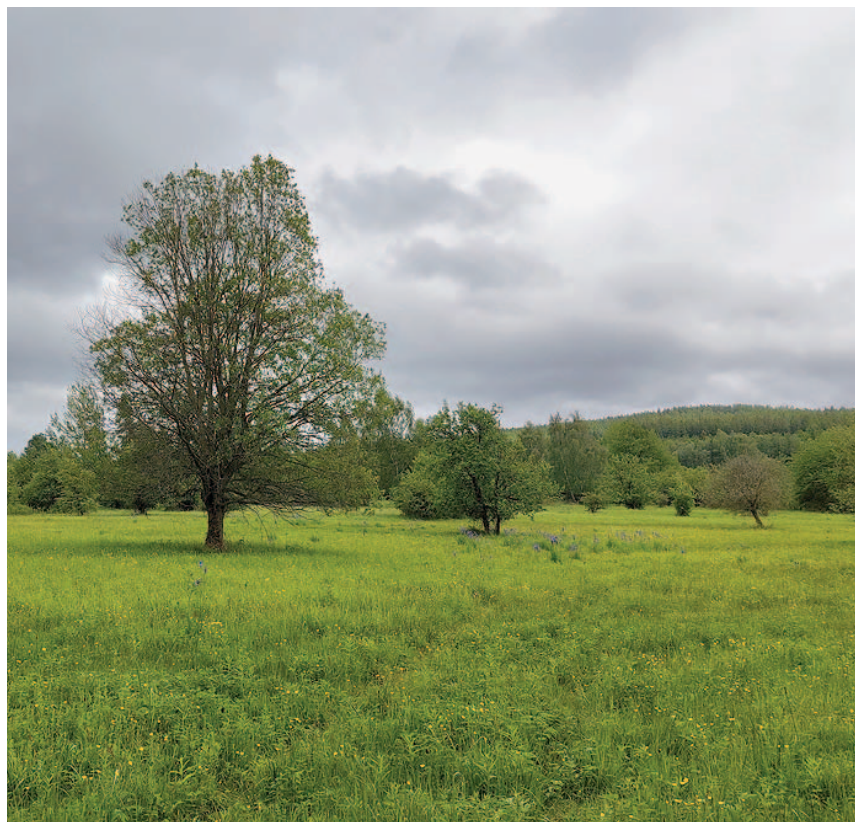
Hrachoviště a v pozadí Beranec.