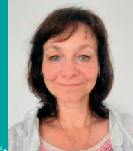
TERÉNNÍ SOCIÁLNÍ PRACOVNICE