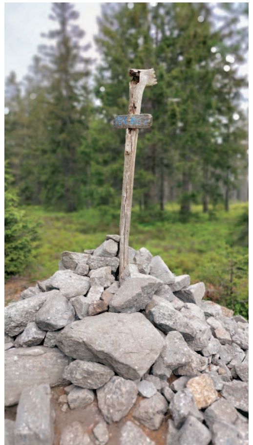
Na Toku, na vrcholu.