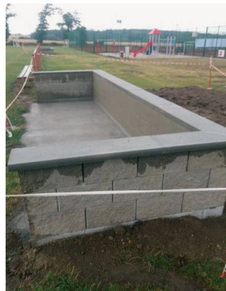
Střídačky v průběhu přestavby.