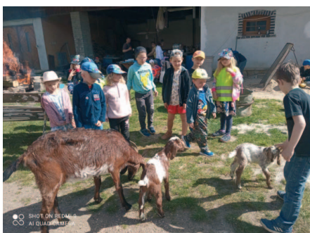
Farmapark u Toma nabízí dětem spoustu zážitků.