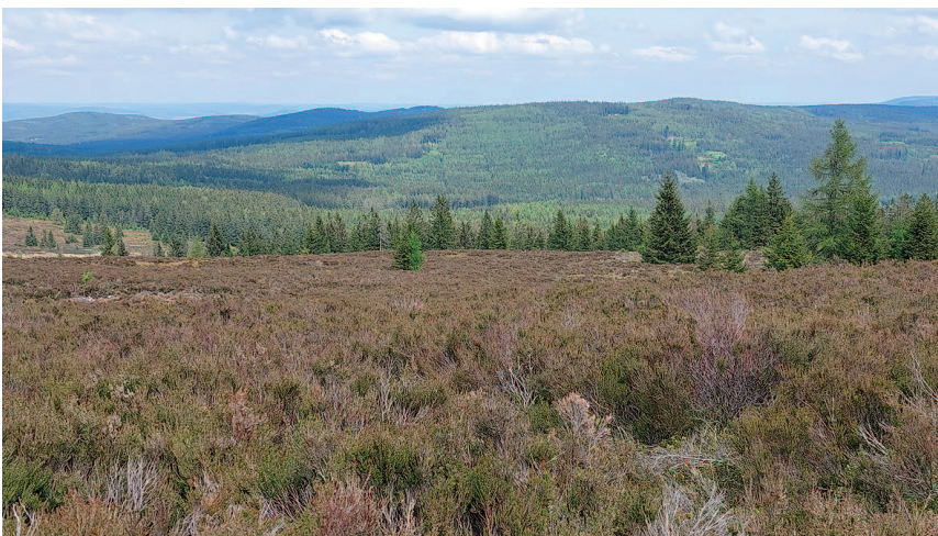
Tocká planina, v létě tu kvetou vřesy.