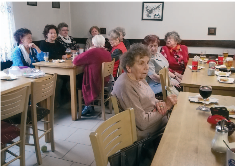
Posezení pro důchodce.