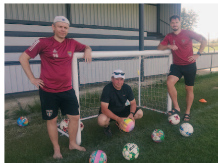
Fotbalové tréninky pod vedením místních fotbalistů byly také oblíbené.