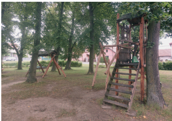
Dětské hřiště po revitalizaci.

V průběhu jarních měsíců byla uskutečněna oprava herních prvků včetně provedení ochranného nátěru za 34.260,- Kč a byla zakoupena krycí plachta na pískoviště se zahradním setem PIKNIK za cenu 7.000,- Kč. Hřiště bylo znovu otevřeno v dubnu 2024.