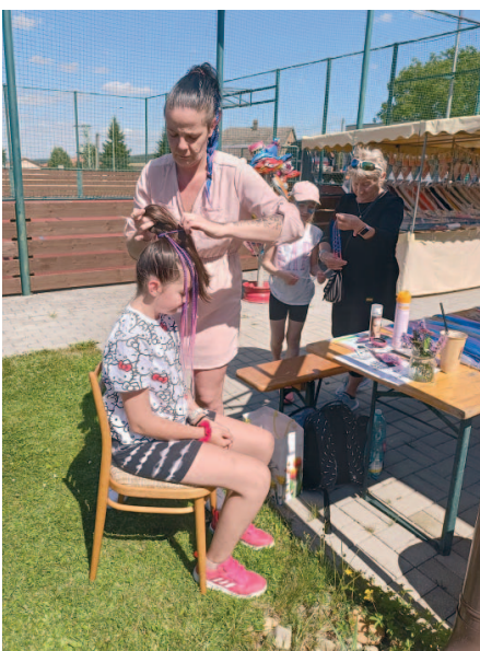
Téměř všechny holčičky odešly domů s copánky.