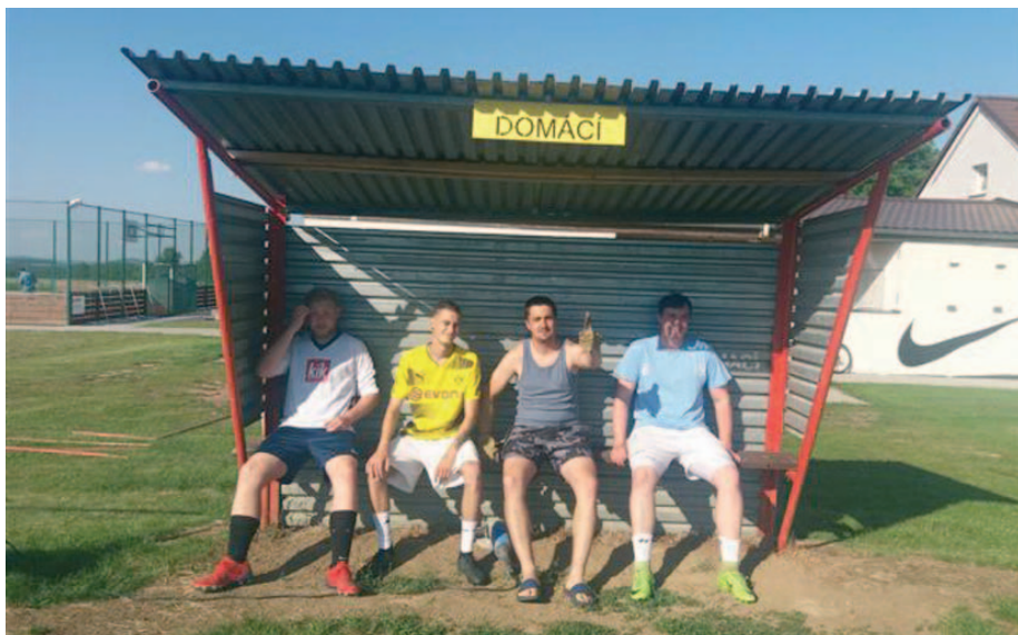
Pro pamětníky: střídačky před rekonstrukcí.

Chtěl bych navázat na předchozí článek v Podlužském zpravodaji a to shrnutím několika posledních let s ohledem na provádění rekonstrukce v našem areálu. V posledních letech se snažíme každý rok realizovat jednu akci na zvelebení našeho areálu. Od roku 2017 se nám povedlo uskutečnit několik akcí, při kterých došlo k opravě nebo vybudování nového zařízení. Jako první proběhla akce na opravu fasády a střechy na hospodářské budově. Na této budově máme od roku 2017 novou krytinu. Komplet vybudované nové podbití a zároveň novou fasádu.