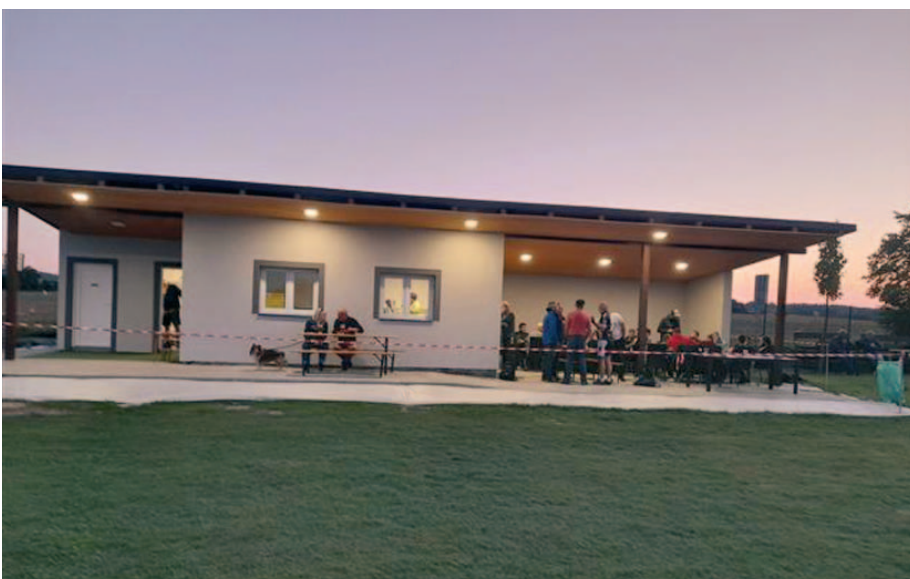
Nová budova občerstvení s posezením.