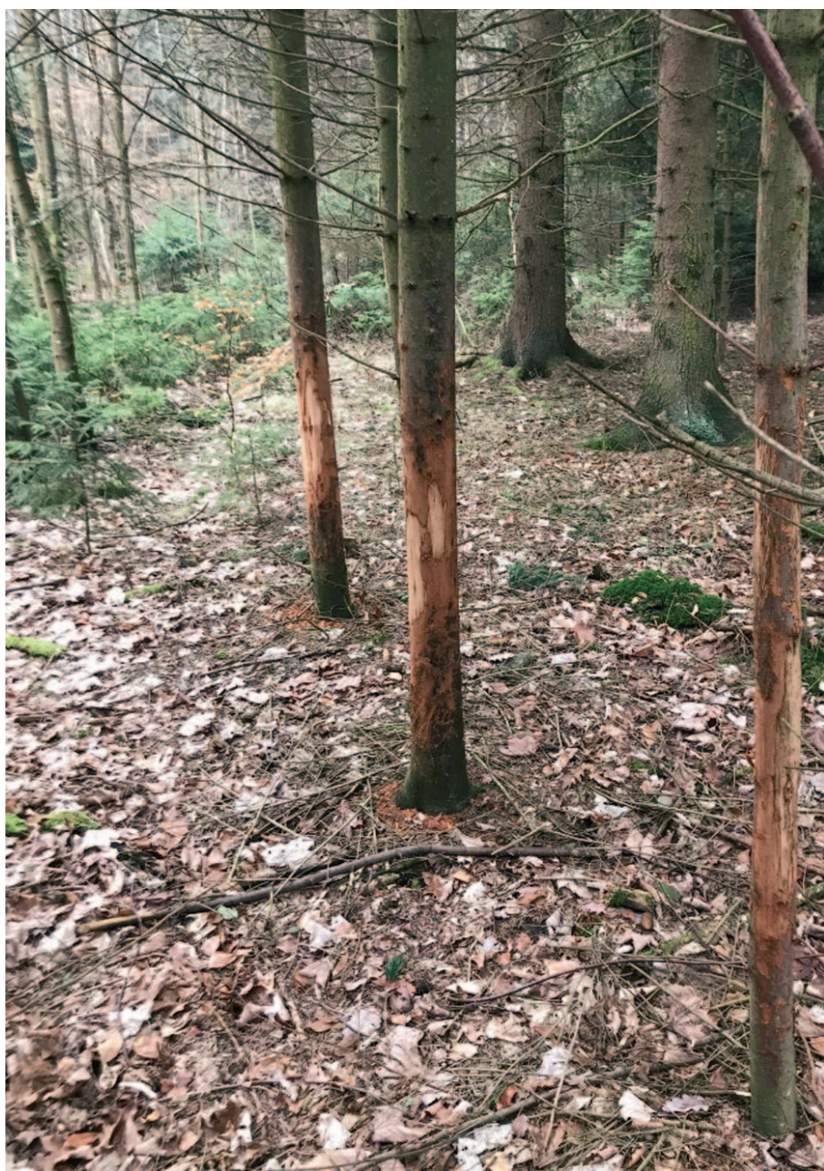
Škody na lesním porostu způsobené volně žijící zvěří.