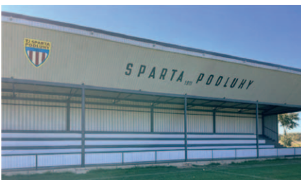
Tribuna po realizaci.

Stánek hotov a už nic nebránilo oslavám 110 let TJ, které jsme při tomto všem již rok dopředu plánovali. Tyto oslavy 110 let jsme pořádali 19.9.2021 v 10.30 hodin slavnostním výkopem hráčů a herců z klubu AMFORA. I za ne zrovna dobrého počasí tyto oslavy proběhly za spokojenosti všech.