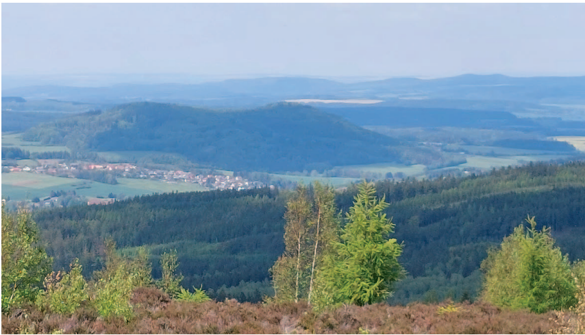
Pohled z Houpáku na Jivinskou horu.