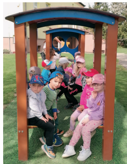
Děti na zahradě Mateřské školy.