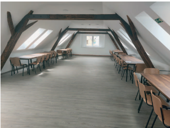
Podkroví obecního úřadu po rekonstrukci.