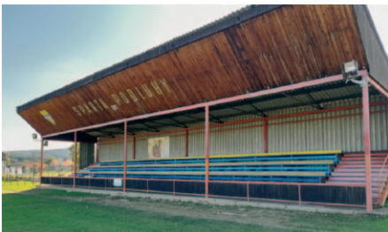
Tribuna před realizací.