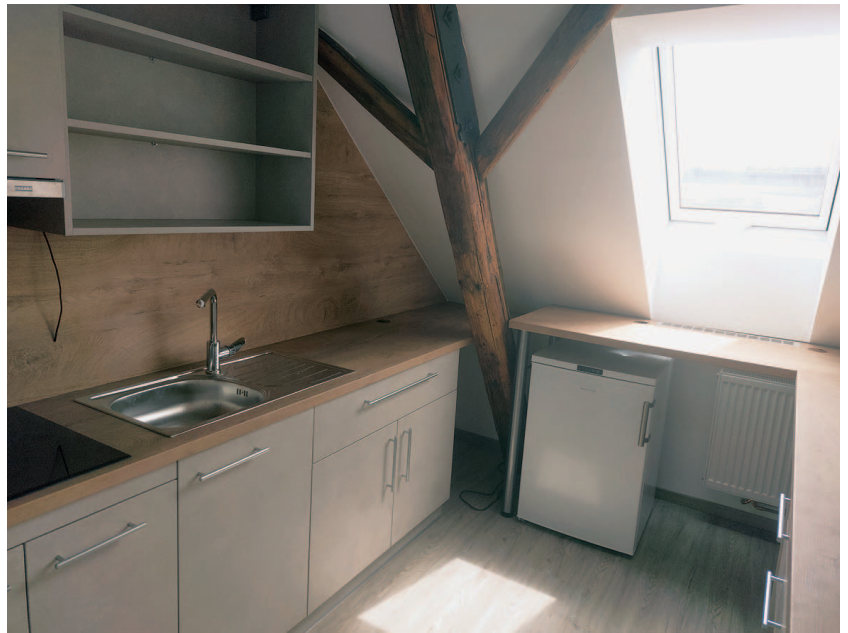
Nová kuchyňka vznikla v podkroví obecního úřadu.