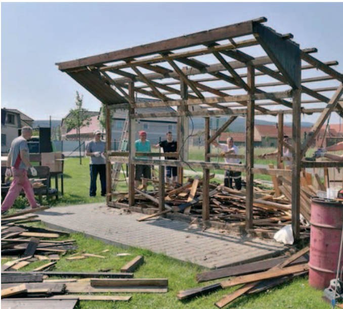
Průběh bourání stánku s občerstvením.