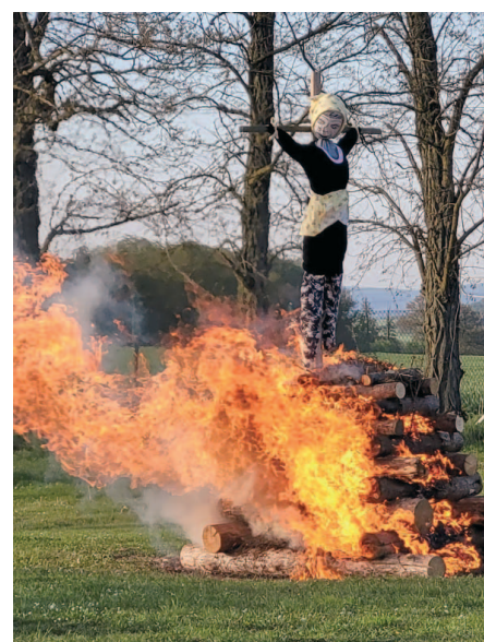
Hranice s čarodějnicí.