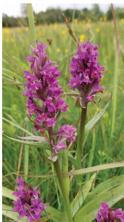
Hrachoviště a místní flora - Prstnatec májový.