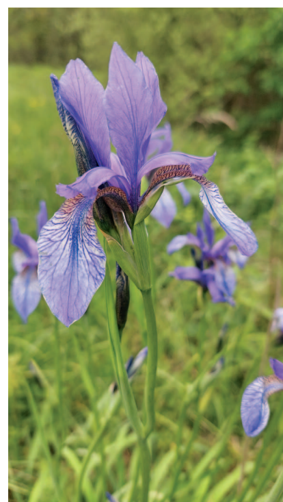
Hrachoviště a místní flora - Kosatec sibiřský.