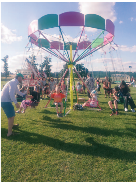
Řetízkový kolotoč byl neustále plný dětí.