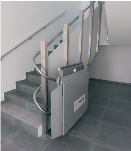
Schody do pokroví obecního úřadu mají schodišťovou plošinu pro vozíčkáře a invalidy.