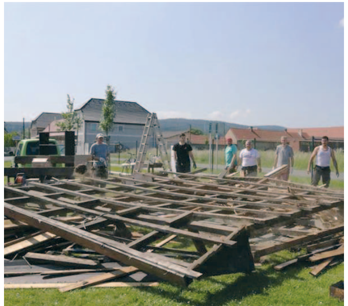
Průběh bourání stánku s občerstvením.

Prvně jsme plánovali opět dřevěnou stavbu, ale nakonec opět zvítězil názor, že to budujeme pro dalších „x“ generací a tak se šlo do kompletní nové stavby a jak jinak než zase svépomocí.