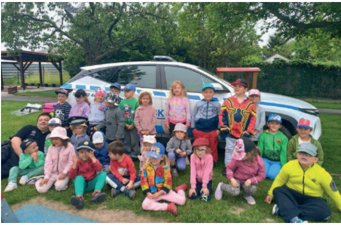
Návštěva policistů Městské policie Žebrák.