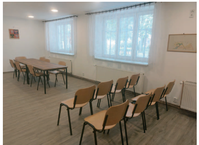
Přízemí obecního úřadu po rekonstrukci.