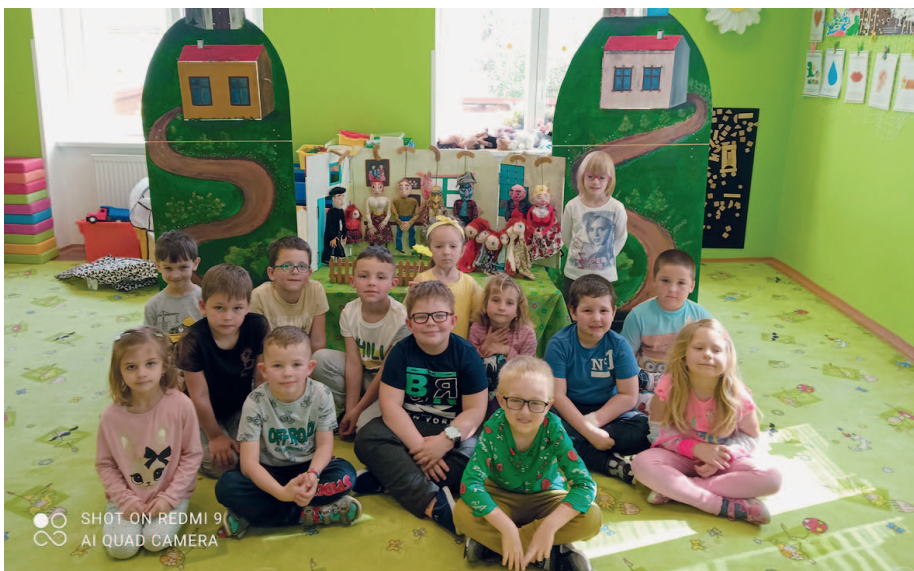
O Lakomé Barce je název pohádky, kterou nám zahrálo divadlo Vanička.