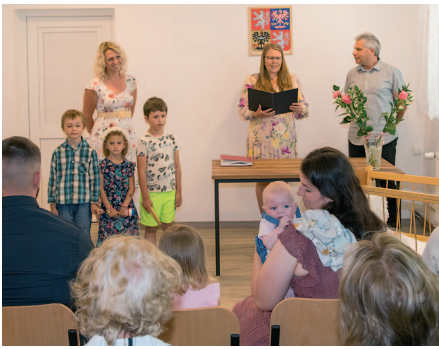
Zástupci obce přivítali nové občánky.