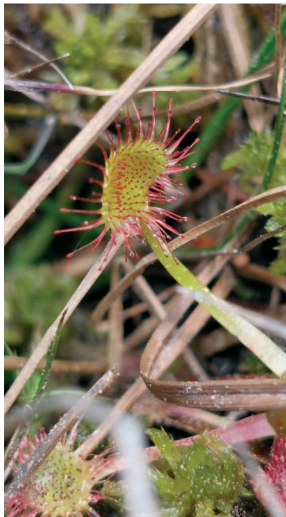
Na Toku, Rosnatka okrouhlostá.