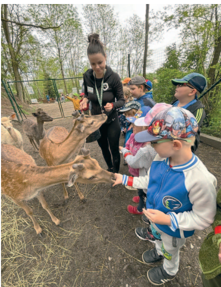
Farmapark u Toma nabízí dětem spoustu zážitků.