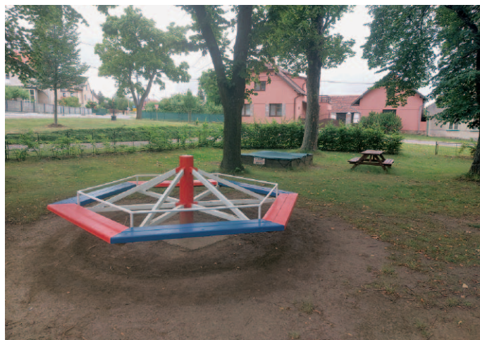
Dětské hřiště po revitalizaci.