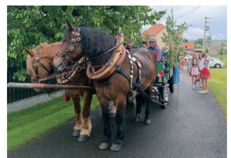
Nechyběl povoz s koňmi.