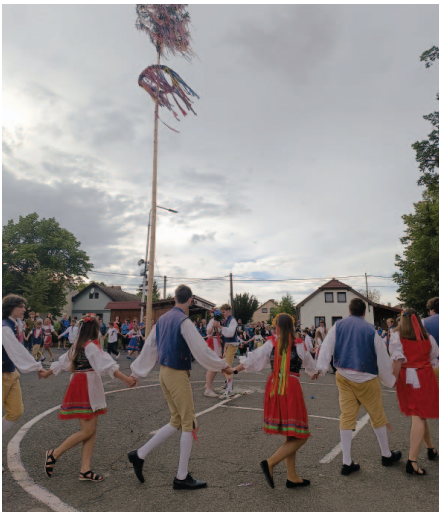
Tančení staročeské besedy pod májí.