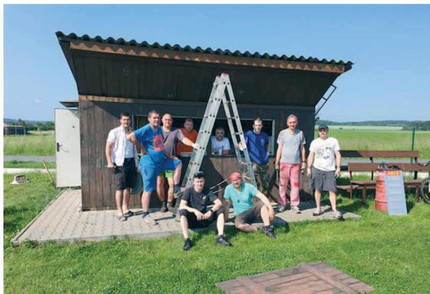
Původní stánek s občerstvením.