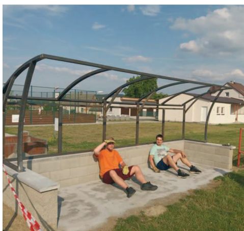
Střídačky v průběhu přestavby.

Následující rok jsme se chystali k rekonstrukci střídaček, které již delší dobu bylo náročné opravovat a zároveň pro hráče již tyto střídačky nebyly vyhovující a ani bezpečné. Tuto rekonstrukci jsme ve finále pojali jako kompletní přestavbu. Staré střídačky jsme poslali do sběru a svépomocí si vybudovali nové zděné, které můžete vidět na přiložených fotografiích. Tato akce se povedla i díky mládežníkům (viz fotky), kteří přispěli nemalou měrou.