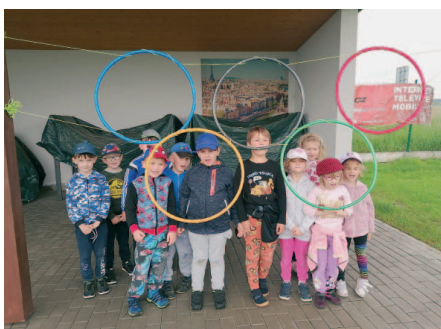
Domeček Hořovice pro nás připravil Olympijské hry.