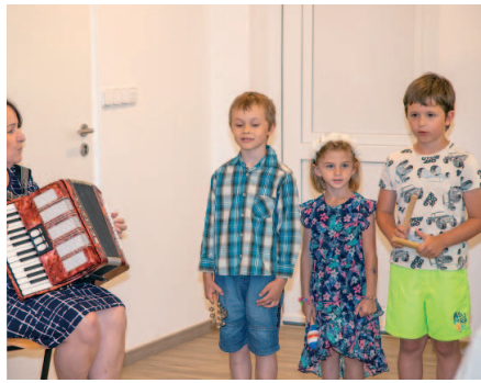
Děti z Mateřské školy zpívaly a recitovaly.