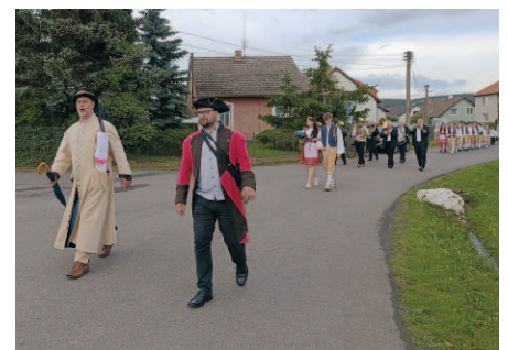
Průvod obcí v popředí s kecalem a drábem.