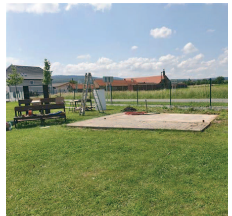
Základová deska stánku s občerstvením.

Nebylo to nic jednoduchého. Bylo za tím nespočet hodin nás Všech, ale myslím, že to stálo za to. Kolektiv se při brigádách ještě více stmelil. Uplatnění na stavbě našli všechny profese a leckdo se naučil novému řemeslu.