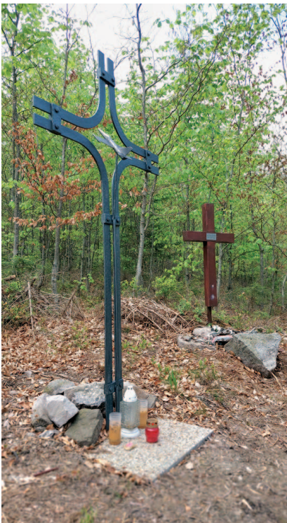
Místo dopadu stíhačky nedaleko Houpáku (únor 2003).