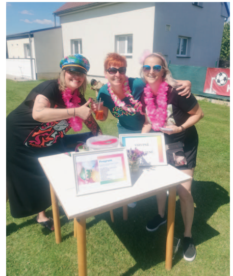
Dámy u vstupu měly skvělou náladu.