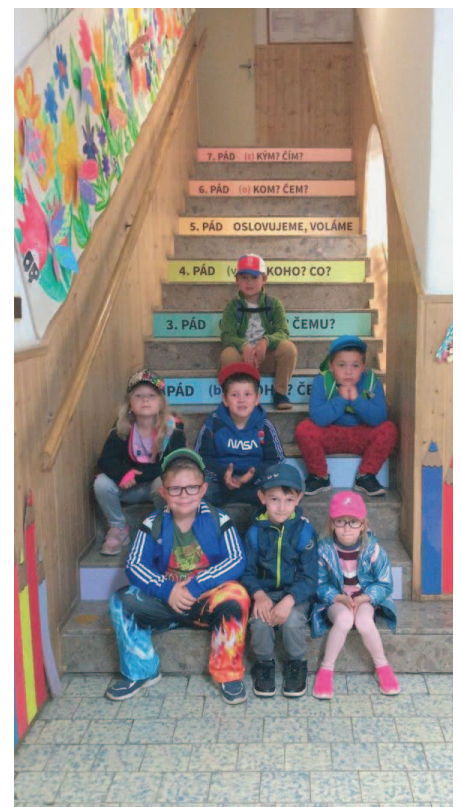
Předškoláci spolu se svými učitelkami navštívili první třídu ve 2. ZŠ Hořovice.