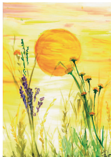
Kresba od Emy Stloukalové.

Zpravodaj může sloužit i k inzerci firem a jiných soukromých subjektů, které mají sídlo v obci.