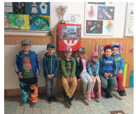
Předškoláci spolu se svými učitelkami navštívili první třídu ve 2. ZŠ Hořovice.