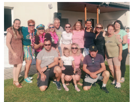
Organizátoři Dětského odpoledne.