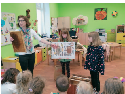
Zajímavé vyprávění o životě včel připravila pro děti paní Stránská s dcerami.