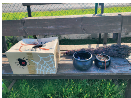
Jeden z úkolů pro děti na čarovné stezce.

Od 17 hodin se začaly slétat na fotbalové hřiště všechny čarodějnice, aby děti provedly čarovnou stezkou plnou zajímavých úkolů, přes kouzelnou pavučinku, skoky v kouzelném pytlíku až po kotlík plný hadů a hmyzu. Všechny děti byly odměněny drobným dárkem za splnění úkolů a následně už se mohly vrhnout na opékání buřtíků a další dobroty. Protože nám nakonec počasí opravdu přálo, mnoho z nich využilo i odměnu v podobě točené zmrzliny U Ládi a vodních pistolek, které osvěžily i nejednoho rodiče. I pro dospělé bylo občerstvení zajištěno a závěrem večera byla zapálena symbolická hranice s čarodějnicí.